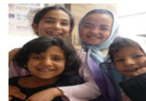
4 Mädchen sind Freundinnen geworden und genießen das Leben im Steinhaus

Das Projekt „Steinhaus Kabul“ knüpft nahtlos an diese Arbeit an, indem es den Kindern neue Perspektiven für Ihre Zukunft eröffnet.