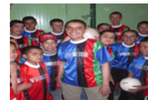
die Jungen lieben Fußball spielen - das Team „Steinhaus“